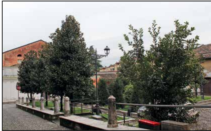
L'attuale situazione di piazza Teatro.

Vi chiederete cosa c'entra questa via con il ripristino della piazza Teatro. Credo che l'amministrazione dovrebbe prendere in considerazione un progetto molto più vasto che coinvolga il quadrilatero del centro storico, analizzare le sue caratteristiche, le esigenze commerciali, la presenza di un notevole flusso di persone, a piedi, in bicicletta e con le carrozzine e prendere delle decisioni che, se al momento sembrano creare del disagio, possono sicuramente trovare in poco tempo una vivibilità in funzione anche di un progetto turistico per la valorizzazione delle nostre peculiarità cultu-