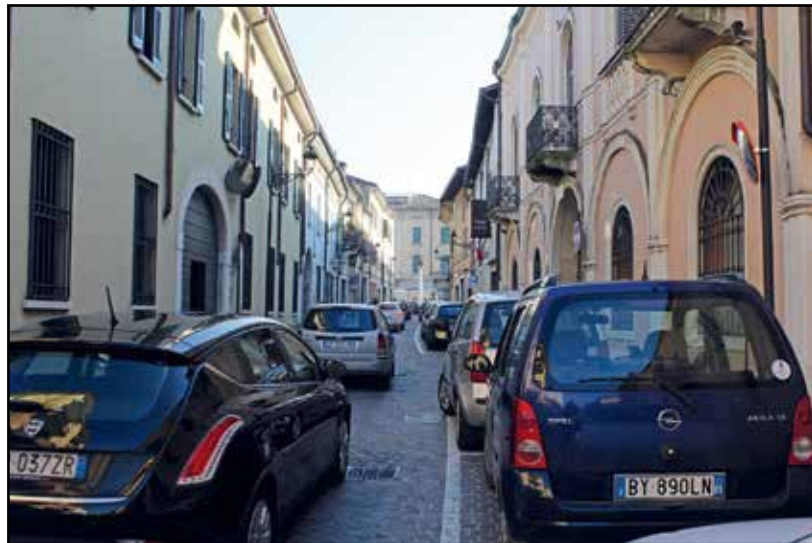
Il traffico su via Martiri della Libertà.