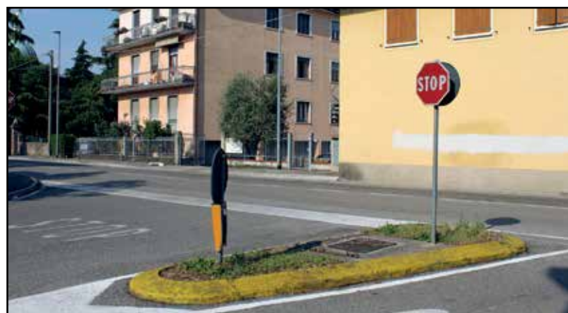
L'aiuola da sistemare all'inizio di via Ten. Silvioli.