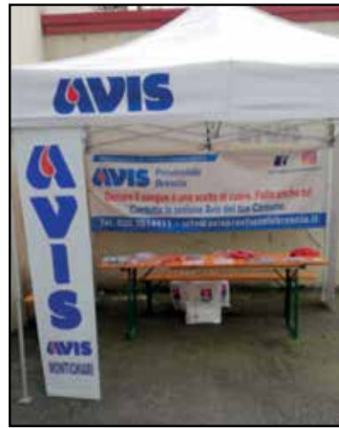
Lo stand dell'Avis a Seridò. loro bambini e di buon auspicio quindi per futuri donatori. Un grazie va all'Avis di Brescia e a noi avisini della sezione

Avis a Seridò 2018 Anche per questa edizione di SERIDO' 2018 l'Avis Provinciale di Brescia, con la collaborazione attiva della sezione Avis Montichiari, ha presenziato con un gazebo promozionale a tutte le giornate di questa manifestazione, che vede arrivare moltissime famiglie da tutta Italia. Simpatici i gadget, alcuni nuovi, regalati ai bambini, pretesto per scambiare quattro chiacchiere con i genitori di Avis e regalare loro un paio di opuscoli informativi utili e chiari. Molti di questi genitori hanno riferito di essere già donatori di sangue, buon esempio per i