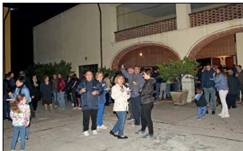
Alcuni dei partecipanti alla cerimonia presso la Cascina Razio.

l'attenta partecipazione nel segno della pace con la tipica accoglienza che è propria del mondo agricolo.