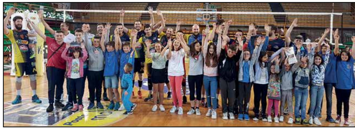
Il saluto finale della squadra con i numerosi giovani sostenitori.

mo ma è la giusta sentenza di una stagione complicata fin dall'inizio, l'obiettivo prefissato non è stato raggiunto ma rimane il fatto di aver disputato comunque un buon campionato, potevamo fare meglio, certo, ma chapeau agli avversari. Arrivederci all'anno prossimo Amici del Volley, sempre qui al mitico PalaGeorge! Noleggio Lorini Volley Montichiari