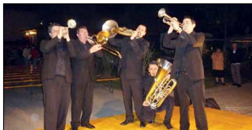
L'esibizione dei "Verona Concentus Ottoni"